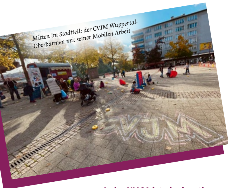
Mitten im Stadtteil: der CVJM Wuppertal-Oberbarmen mit seiner Mobilen Arbeit

»Suchet der Stadt Bestes und betet für sie zum Herrn.« (Jer 29,7) Was hat dieser Aufruf an die Exilanten in Babylon mit der »Vision 2030« und unserem Wirken als CVJM zu tun?