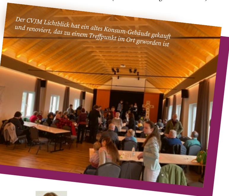
Der CVJM Lichtblick hat ein altes Konsum-Gebäude gekauft und renoviert, das zu einem Treffpunkt im Ort geworden ist