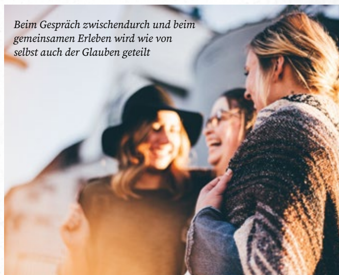
Beim Gespräch zwischendurch und beim gemeinsamen Erleben wird wie von selbst auch der Glaube geteilt