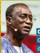
Carlos Sanvee Generalsekretär des World YMCA