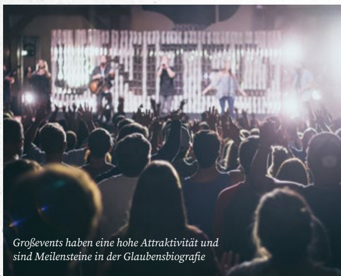
Großevents haben eine hohe Attraktivität und sind Meilensteine in der Glaubensbiografie